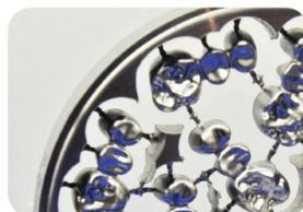
손쉬운 기공 작업